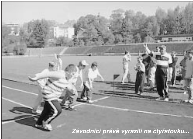
Závodníci právě vyrazili na čtyřstovku...

Ve Frýdku-Místku už delší dobu působí Junior klub křesťanských demokratů (JK KD). Jedná se občanské sdružení, jehož snahou je aktivní práce v naší společnosti a spolupráce s dalšími mládežnickými celky politických stran, navazování kontaktů se zahraničními partnery podobných sdružení. Usiluje rovněž o zlepšení informovanosti veřejnosti a v tomto duchu také pořádá semináře, setkání a kongresy mladých lidí o aktuálním politickém i odborném dění v celé republice. JK KD citlivě reaguje na současnou celospolečenskou rezignaci na veřejné dění. Na základě svých myšlenek, vycházejících z křesťansko-demokratické kultury, oslovuje mladé lidi, občany, kteří nejsou a nechtějí být lhostejní k vývoji společnosti, ve které žijí a ve které budou vyrůstat i jejich děti. Pokud si myslíte, že můžete být prospěšní svému okolí a chcete se do práce klubu zapojit, kontaktujte JK KD na telefonu 0602-564 457 nebo www.juniorklub.cz