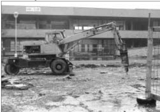
Celková rekonstrukce prostranství neprobíhá jen na náměstí Svobody, ale také před kinem Petra Bezruče. Místečané si letos bahna skutečně užijí, zadoštiččením snad bude příští rok město celé v novém.

V listopadu už podruhé v tomto roce proběhla na transfúzním oddělení Nemocnice ve Frýdku-Místku akce "Daruj krev s Tescem". Za první dva týdny měsíce listopadu bylo odebrána krev od 250 dárců, z tohoto počtu poprvé transfúzní stanici navštívilo 20 dárců. Ve stejném časovém období bylo pacientům naší nemocnice podáno 241 transfúzních jednotek krve. Pracovníci transfúzní stanice Nemocnice ve Frýdku-Místku děkují hypermarketu Tesco za podporu dárcovství krve.