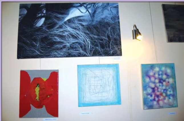
SALON: Ve frýdecké Galerii Pod Svícem jsou k vidění zajímavé artefakty v rámci kolektivní přehlídky, tentokrát na téma Chvění.