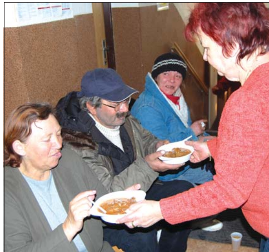
GULÁŠEK PRO BEZDOMOVCE: V azylovém domě Bethel zástupci frýdecko-místecké radnice před Vánocemi počastovali lidi bez přístřeší. Zájem byl mimořádný.