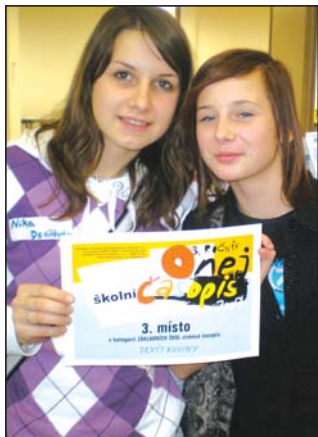
Devítkoviny z 9. ZŠ Frýdku-Mítku získaly 3. místo

Devítkoviny nabízejí informace o konaných akcích, které doplňuje fotodokumentace, v časopise nechybí ani informace pro rodiče, výzvy, soutěže, ankety, sportovní noviny nebo tipy na volný čas. Devítkoviny se zrodily v roce 2004. Vycházejí čtyřikrát ročně.