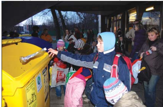
MIKULÁŠ NA LEDĚ: Vstupenkou na bruslení bylo odevzdání vytříděného odpadu.

V předchozím roce se těšil Mikuláš na ledě také návštěvnosti, že až ohrožovala vlastní činnost bruslení. Letos si pořadatelé pochvalovali, že počet návštěvníků byl „tak akorát“. (pp)