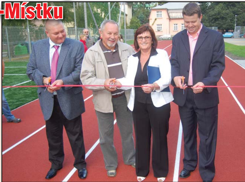
HODNĚ SLÁVY: Radnice se v uplynulém roce činila, příležitostí k slavnostnímu přestřihávání pásky bylo opravdu mnoho.

Statutární město Frýdek-Místek dokončilo další etapu rekonstrukce smuteční obřadní síně na