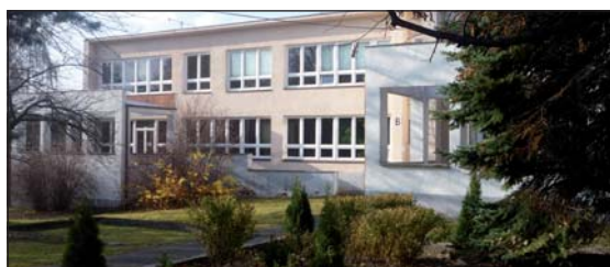
GOODWILL: Budova školy.

známili i s nabídkou netradičních profesí, které zpětně museli popsat a charakterizovat. Nezapomnělo se však ani na relaxační část. Kromě vycházek do okolí mohli žáci využívat plně i služeb relaxačního wellness centra v hotelu Odra. Příjemný personál a skvělé služby byly tou nejlepší tečkou za třídenním pobytem žáků, naplněným až do pozdních večerních hodin aktivní činností. Renata Spustová