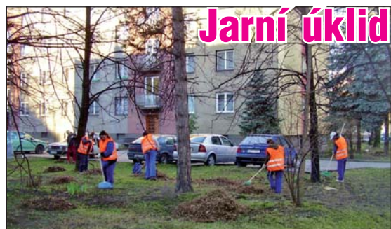
JARO ODKRÝVÁ NEPOŘÁDEK: O úklid se starají pracovníci technických služeb.

také dětská malířská soutěž o „Nejhezčí papírové vejce.“ Děti tak budou moci v kreativním koutku na náměstí malovat. Vylosovaní malíři získají vstupenky na některou z nedělních divadelních pohádek KulturyFM. Součástí sobotního programu bude i ukázka domácího zvířectva a práce pasteveckých psů v duchu valašských tradic. Nebudou chybět ani tvořivé dílny divadla Čtyřlístek. (pp)