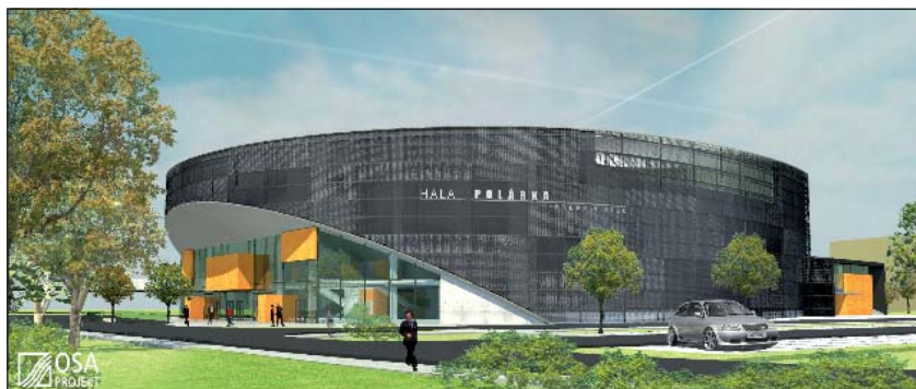
Vizualizace haly Polárka