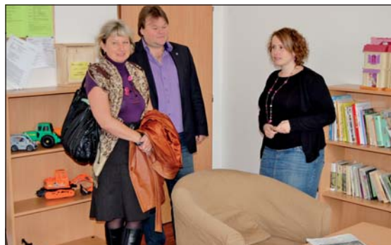
V AZYLOVÉM DOMĚ: Zástupci města na dni otevřených dveří s vedoucí střediska.

Hřbitovy v Chlebovicích, v Lysůvkách a evangelický hřbitov v Lískovci budou v období od 26. října do 5. listopadu přístupné bez časového omezení. Hřbitovy ve Skalici, ve Frýdku a katolický hřbitov v Lískovci zavřou své brány ve 20 hodin, v dalších dnech pak v 18 hodin.