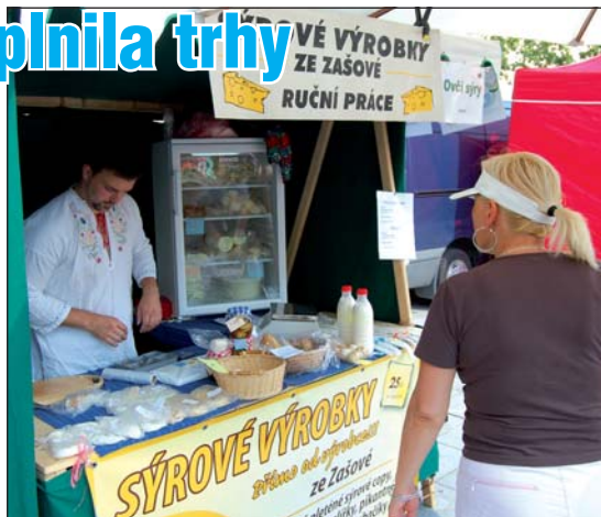
PŘÍMO OD VÝROBCE: Za některými vyjela autobusová výprava.

Beskydské farmářské trhy na náměstí Svobody v Místku letos ještě nekončí. V listopadu jsou tematicky zaměřeny – 1. listopadu na dušičky a 15. listopadu na zabijačku. Na trzích nebudou chybět oblíbené výrobky z masa a mléka, vejce z podestýlky, sladké i slané pečivo, ovoce i zelenina. 15.