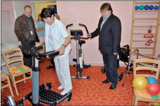
V „TĚLOCVIČNĚ“: Zařízení dbá i na pohyb a rehabilitaci.