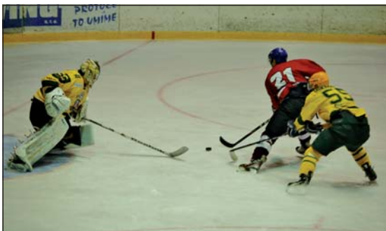
GÓL V OSLABENÍ: Paradoxně ve čtyřech otáčeli domácí zápas ve Vsetínem.

Beskydská šachová škola děkuje všem svým členům za výbornou reprezentaci Frýdku-Místku a zároveň děkuje všem svým partnerům v čele s Městem Frýdek-Místkem za přízeň a projevenou podporu!