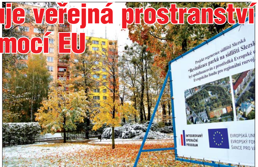
PROJEKTY NA SLEZSKÉ: Přeměny se dočká i místní park u sokolovny.

Prvním projektem je revitalizace parků na sídlišti. V sadech Svobody budou odstraněny stávající chodníky, které nahradí nová dlážděná cestní síť, současný altán bude zbourán, nahradí ho atypické multifunkční zastřešené jeviště opláštěné robustní sklolaminátovou skořepinou a rekonstrukcí projde i kovová vstupní brána z ulice Sadová. Samozřejmě bude nový mobiliář. Nový parčík vznikne za tzv. Sekerovou vilou (bývalou knihovnou), kde by měly ještě letos vzniknout nové dlážděné chodníky a odpočinková plocha s lavičkami. V obou lokalitách dojde ke kácení neperpektivních dřevin, nové výsadbě stromů a keřů a vybudování nového veřejného osvětlení.