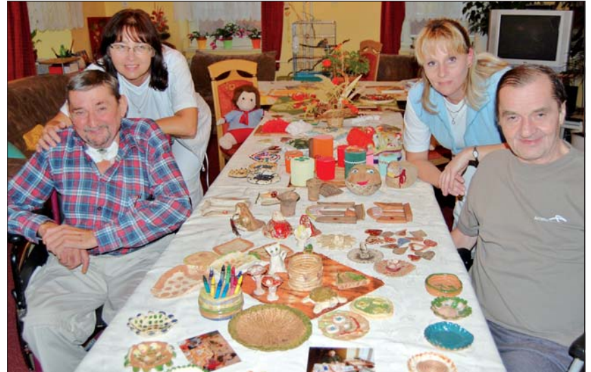
SPOKOJENÍ KLIENTI: Výrobky jsou jejich chloubou.

Dobrovolnické centrum ADRA již třetím rokem využívá štědrosti dárců, prostřednictvím jejichž darů provozuje charitativní obchody a zajišťuje si část zisku k financování svých projektových