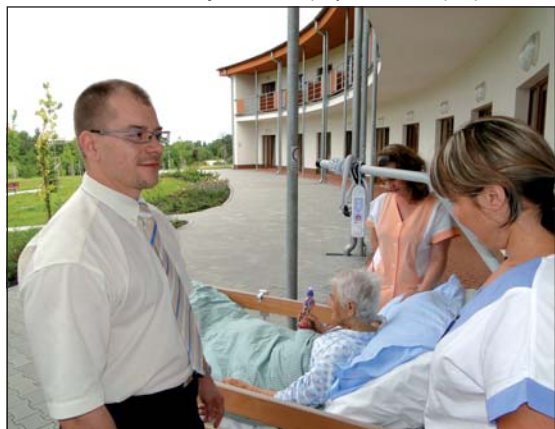
HOSPIC: Zařízení města může získat další finance na vybavení.

24. Zvýšení kvality služeb v hospicovém zařízení – Hospic F-M, nákup pomůcek pro pacienty