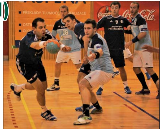
SKP U DNA: Házenkáři Frýdku-Místku podali zoufalý výkon.

Sestava a branky SKP: Šoltes (25%), Marenčák (15%) - Frančík, Klaban 1, Habarta 2, Mynář 2, Petřík 1, Hečko, Dyba 4, Vacula 4/1, Hes 5, Kalous 1, Strack. Trenér Aleš Chrástina.