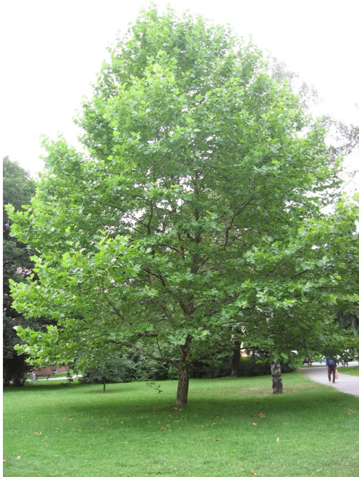
3. Mladý, rychle rostoucí strom platanu javorolistého ( Platanus hispanica ).