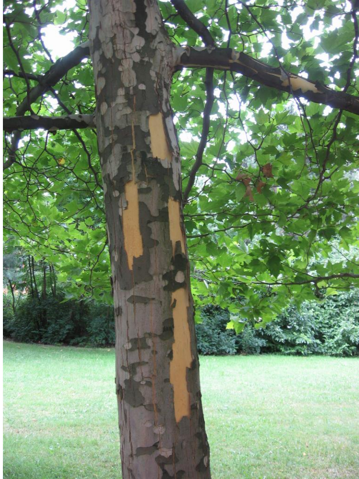
4. Všem platanům se loupe borka ve velkých kusech. Vzniklá mozaika barev je velmi ozdobná.