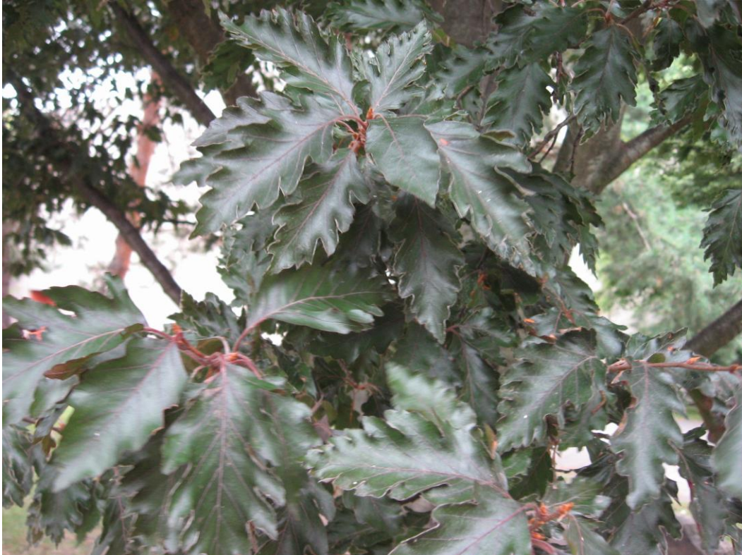
6. Charakteristické listy Rohanova buku ( Fagus sylvatica „Rohani“).