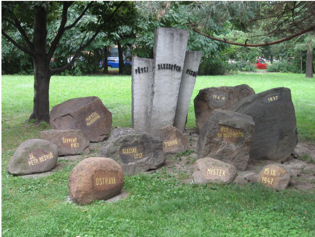
8. Památník „Pěvci Slezských písní“ sem byl přenesen při stavbě průtahu silnice I/48 z okraje Sadů Bedřicha Smetany.