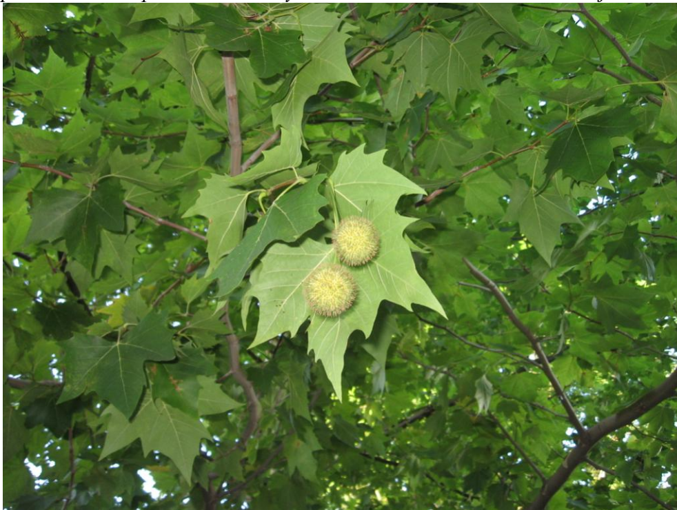
5. Plody platanu tvoří kulovité hlávky.