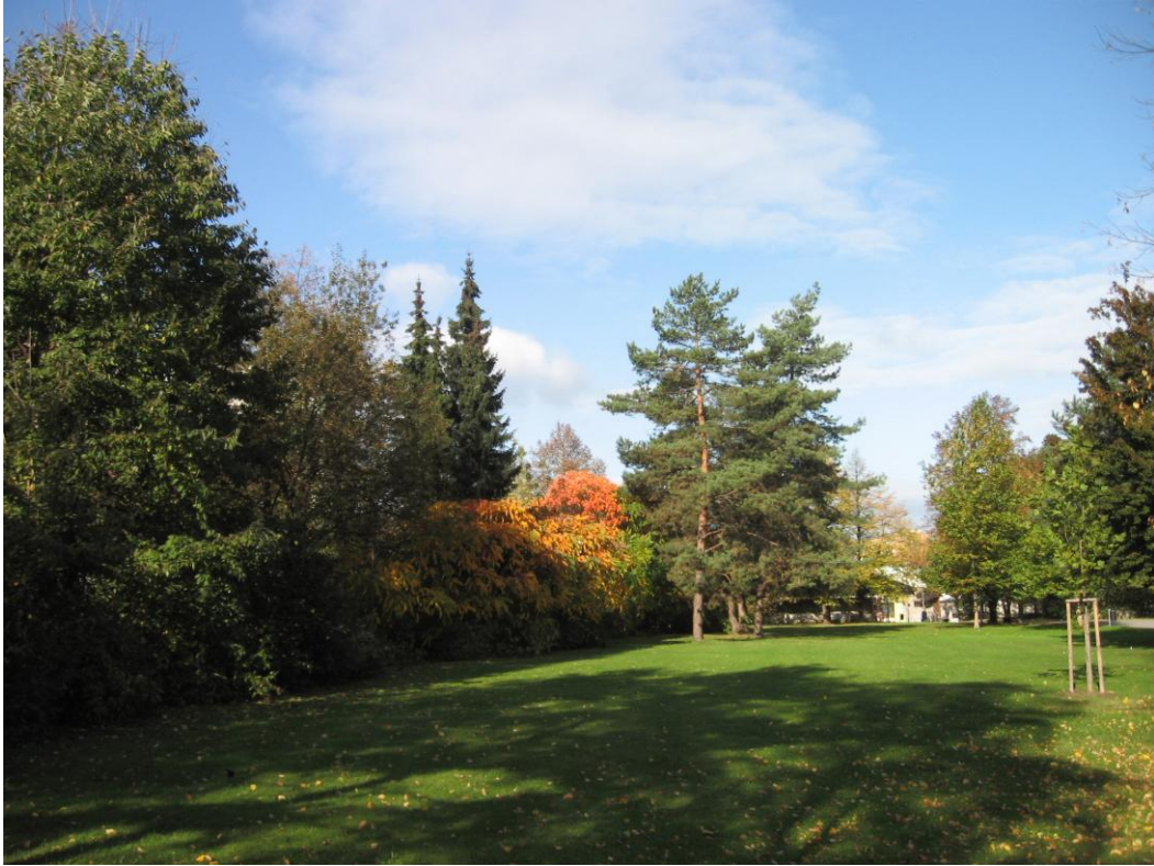
2. Celkový pohled na střed parku, uprostřed podzimní zbarvení škumpy orobincové.