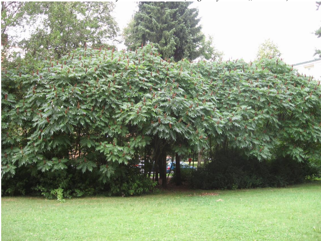
7. Velká skupina keřovité škumy orobincovité ( Rhus typhina ) s červenými latami plodů.