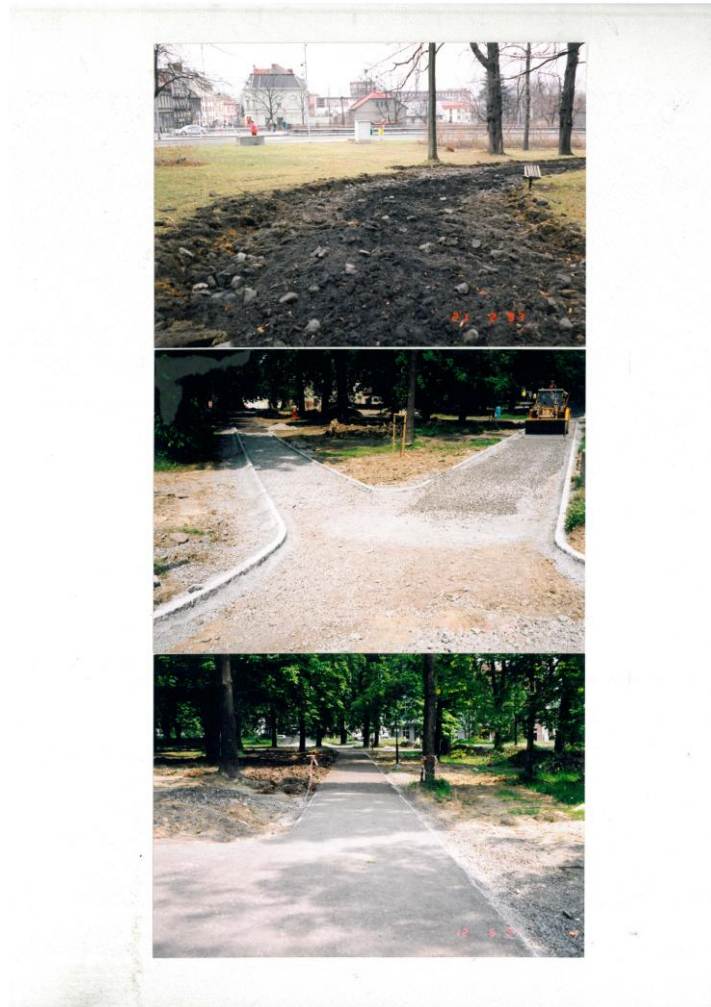
3. Bourání starých a výstavba nových chodníků v roce 1996 a 1997.