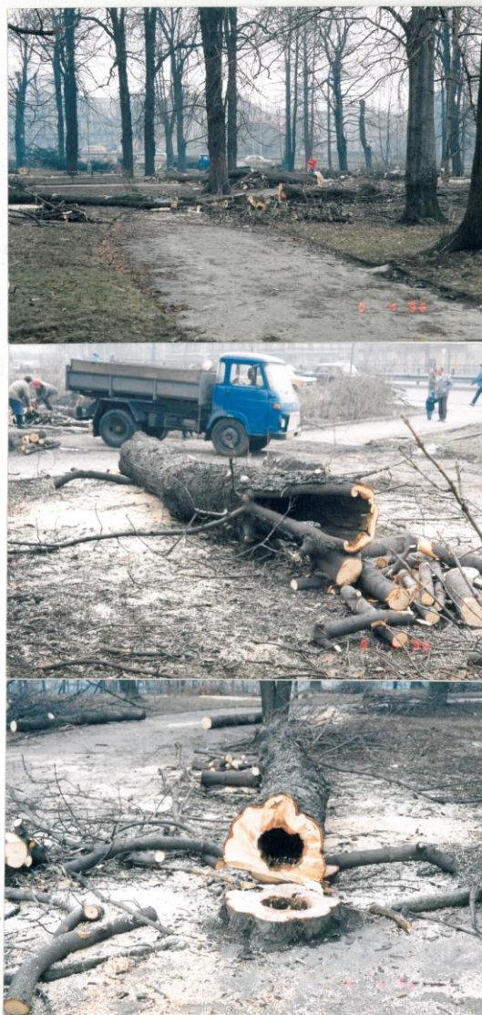
2. Počátek rekonstrukce parku v roce 1996 – odstraňování nevhodných dřevin s rozsáhlými hnilobami a dutinami.

Stálezelený velký keř pocházející ze střední a západní Číny. Velmi odolný vůči znečištěnému ovzduší a je zcela mrazuvzdorný. Kvete bíle a plody se na podzim barví červeně, zcela zralé jsou tmavofialové. Listy jsou až 15 cm dlouhé, na lici tmavozelené a vrásčité, na robu rezavě plstnaté. Jedna z nejodolnějších stálezelených dřevin.