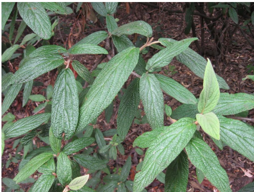
3. Stálezelená kalina vrásčitolistá ( Viburnum rhytidophyllum ) má velké tmavě zelené listy.