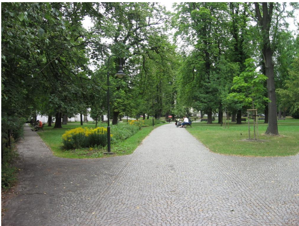
6. Bezbariérový přístup do parku od estakády.