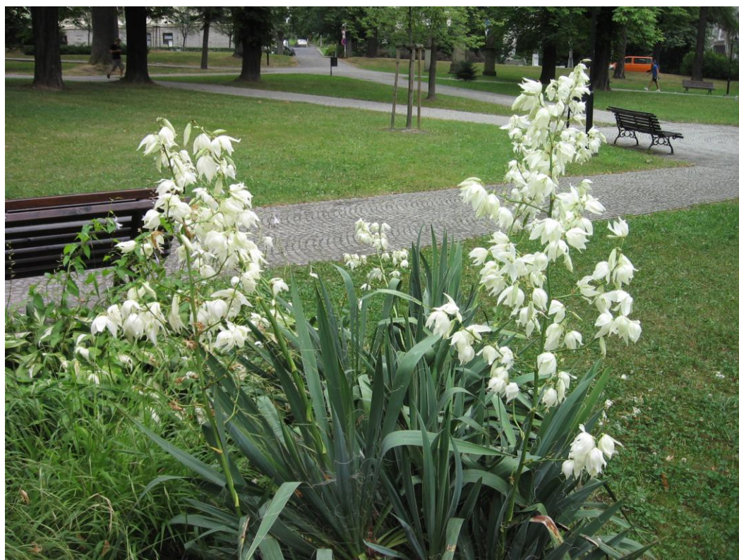
10. Nápadně kvetoucí středoamerická trvalka juka ( Yucca filamentosa ).