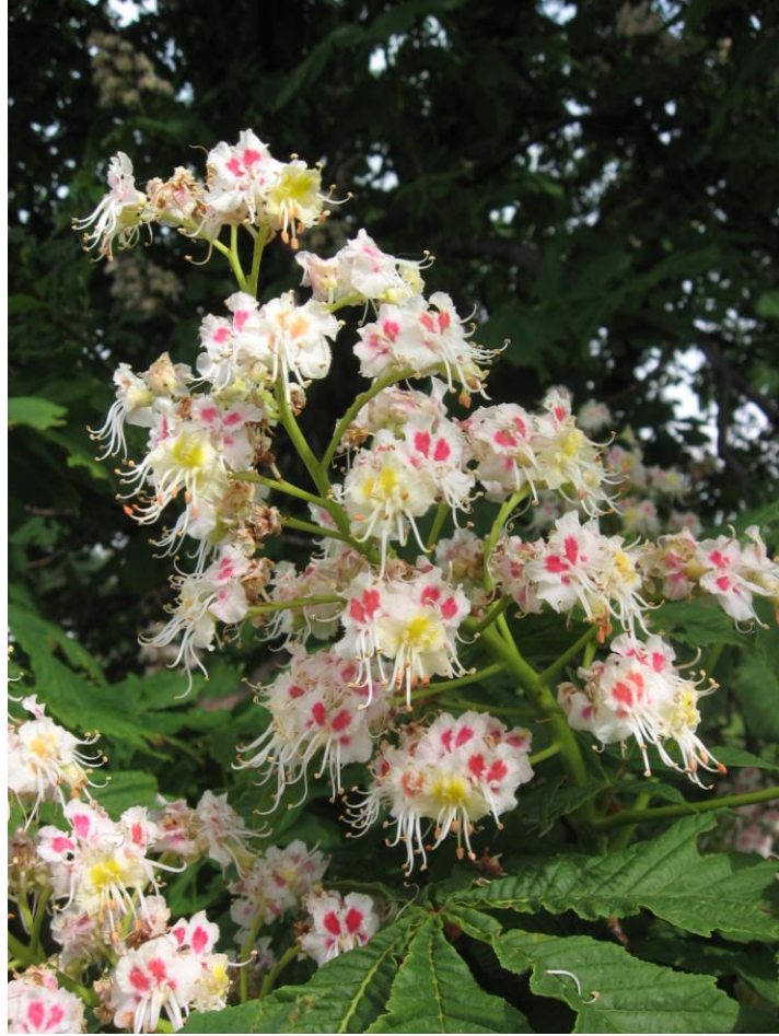
2. Jírovec maďal (Aesculus hippocastanum) není naším domácím druhem, ale podmínky střední Evropy mu plně vyhovují. Patří pro svoje nápadné kvetení stále k velmi oblíbeným dřevinám pro městské prostředí.