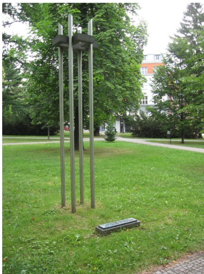
9. Malý památník připomíná, že zde byl do roku 1893 původně hřbitov.