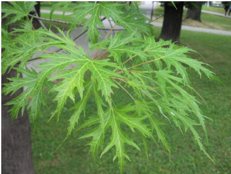
4. Listy javoru stříbrného (Acer saccharinum) jsou nápadně hluboce dělené.