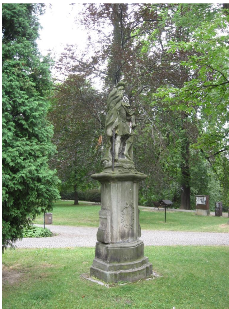
12. Socha sv. Floriána v blízkosti kostela.