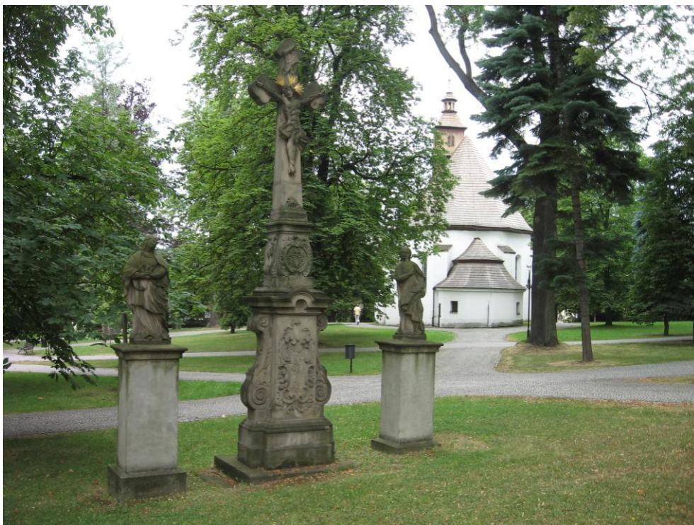
11. Barokní sousoší „Malá Kalvárie“ u vstupu do parku od třídy T. G. Masaryka.