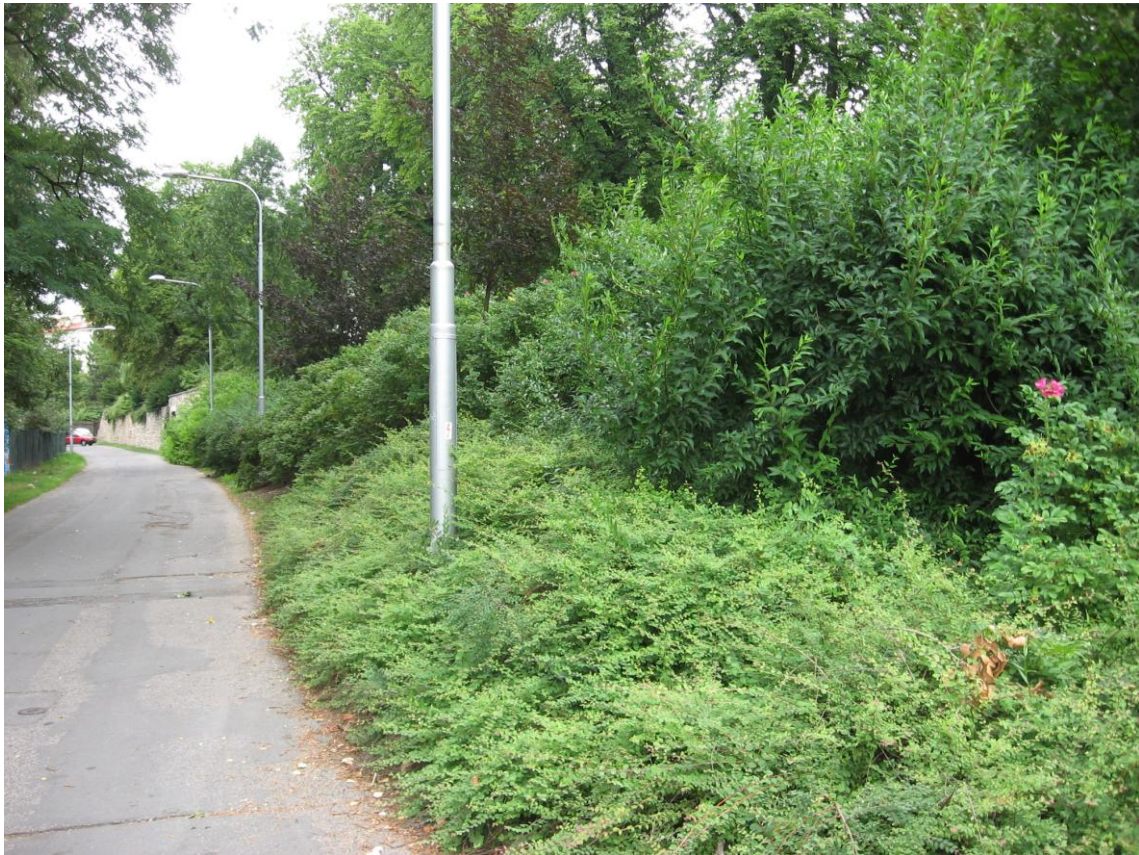
7. Od ulic Těšínské a Hlavní třídy izolují park výsadby keřů.