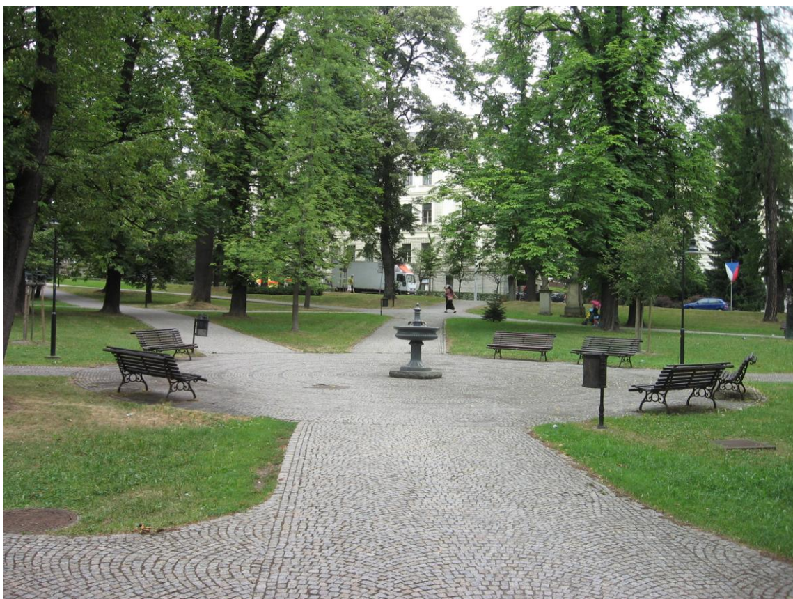
8. Uprostřed parku je fontána s odpočívadlem.