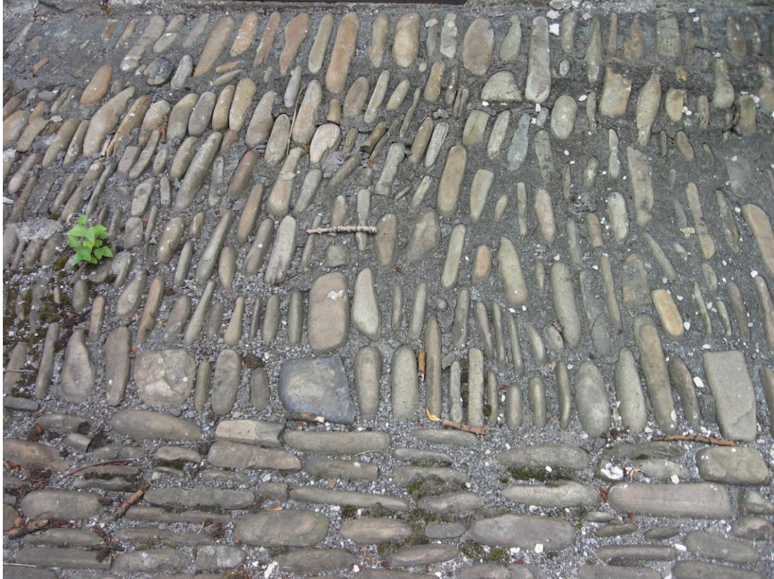
13. Slezská valounová dlažba z říčních kamenů okolo kostela.