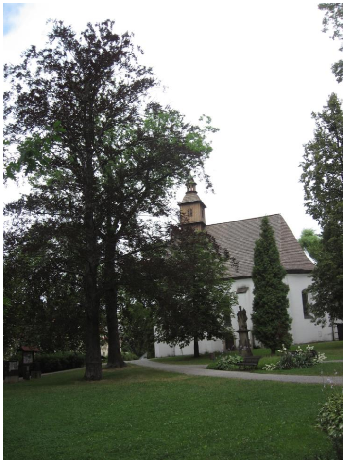
5. Vedle kostela sv. Jošta roste mohutný červenolistý buk lesní ( Fagus sylvatica cv. Atropunicea ).