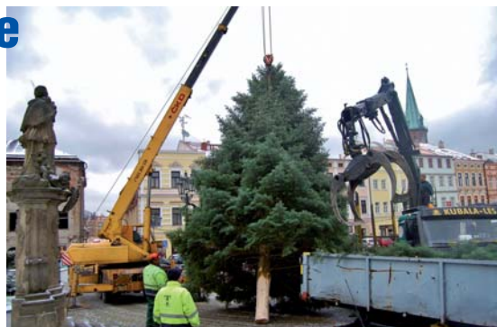
FRÝDECKÉ NÁMĚSTÍ: Instalace jedle technickými službami.

obdivovat různé tvary i barvy ozdob na již tradičních místech, ke kterým patří frýdecké i místecké náměstí, ulice Frýdlantská, Ostravská, Palackého, Těšínská, Politických obětí, Bezručova, Janáčkova, Revoluční, Hlavní třída, ale také Park pod zámek, náměstí Evropy na Riviéře, kulturní dům nebo vlakové nádraží. Světelné ozdoby budou krásit také stromy před 1. ZŠ ve Frýdku a tradičně se nazdobí strom u kostela svatého Jana a Pavla v Místku a desítky dalších stromů v různých lokalitách města. Vánoč-