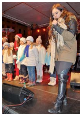
EWA FARNA: Zpěvačka si nejprve stihla dva songy z dětským souborem Podsováček.

projekt nabízející spoustu zajímavých akcí a podnětů, jak příjemně a beze shonu strávit předvánoční čas v okruhu svých blízkých nebo přátel,“ připomíná náměstek primátora Petr Cvik další pestrou navazující zábavný program, který si jistě nenecháte ujít. (pp)