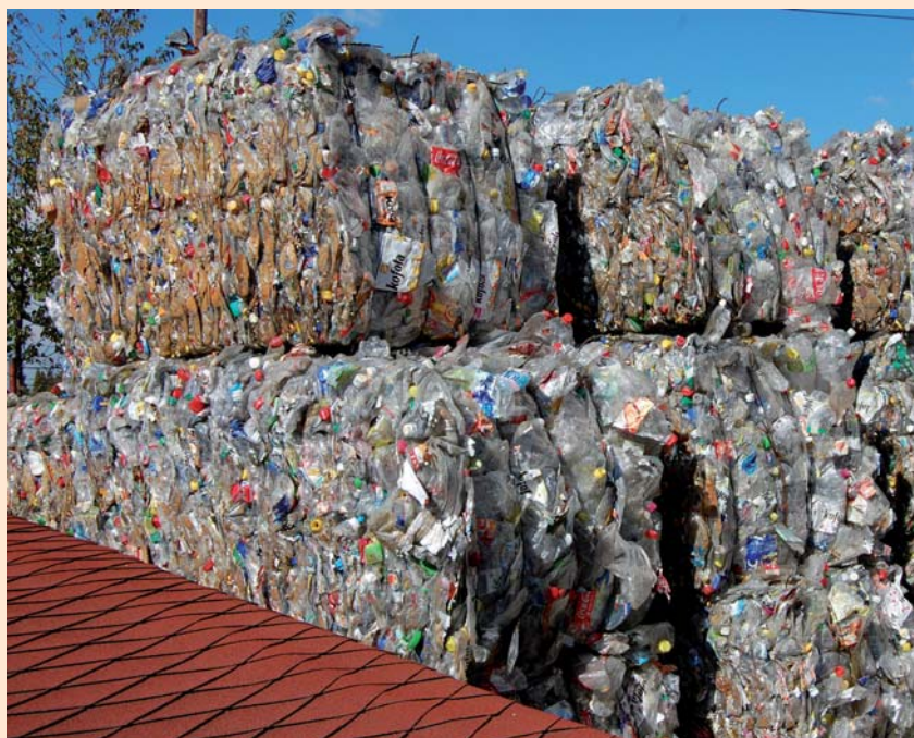
PLASTY: Třídění odpadu šetří finance i přírodu.