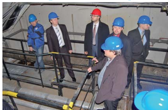
V KOLEKTORU: Takto to vypadá v „podzemním království Distepu“ na Slezské.

Společnost Distep zaměstnává okolo osmi desítek lidí, obhospodařuje téměř čtyřicet kilometrů potrubních tras a kromě distribuce tepelné energie pro vytápění objektů a dodávky teplé užitkové vody zajišťuje správu a údržbu automatických