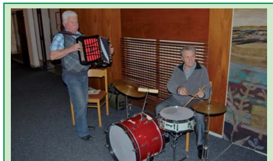
ČAS VÁNOČNÍCH BESÍDEK: V tomto období vedení města a zástupci odboru sociálních služeb navštěvují vánoční akce klubů důchodců, kde senioři bilancují celoroční činnost, baví se a nasávají atmosféru Adventu. V Liskovci u toho nechyběla živá hudba.

22. 11. se městská policie podílela na preventivní akci na ulici Míru, která proběhla v páteční odpoledne, kdy se děti vrátily ze školy a pomohly s úklidem na ulicích Hutní, Skautská a okolí. „Celkem se zúčastnilo 14 dětí, které byly odměněny malým občerstvením. Odpadem se naplnila jedna celá multikára,“ informovala policejní preventistka Lenka Biolková. (pp)