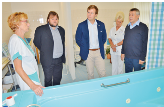
HYGIENA I RELAXACE: Radní rozhodli o další investici, která pomůže klientům i personálu.

„Jedná se o veřejné a nekomerční vysílání formou videodokumentů, ve kterých se divák dozví informace o českých regionech, městech a památkách. Cílem Czech-American TV je rozšířit povědomí o České republice a její kultuře a zviditelnit její turisticky zajímavé destinace. Jeden z pořadů byl zaměřen právě na Frýdek-Místek a na Beskydy,“ přiblížil ředitel televize John Honner s tím,