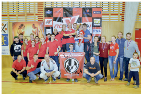
Vítězný tým GB Draculino z Frýdku-Místku.

Více informací najdete na stránkách: www.gbdraculino.cz