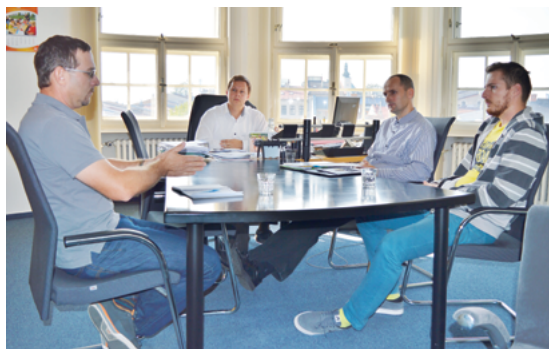
KAM S NÍM?: U skateparku se stále řeší nerudovská otázka.

zástupci těchto sportů, ale chce již co nejdříve přijmout definitivní rozhodnutí, jakým směrem upnout další snažení. Pod estakádou by nemohl vzniknout klasický betonový skatepark, protože podmínkou využití plochy je možný přístup k spodní části estakády. Jako reálnější se jeví model „skate plaza“, kde překážky imitují především městský mobiliář jako zábradlí či schody. Nechyběly by ale ani přenosné překážky a rampy. (pp)