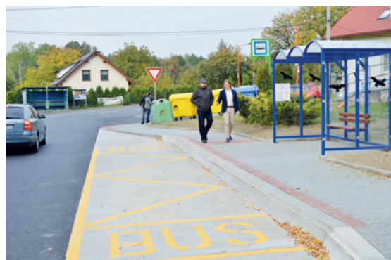
NOVÝ ZÁLIV: V Lískovci přibýly investice za deset milionů korun, na které dlouhé roky občané čekali.

autobusového zálivu naproti požární zbrojnici, jehož účelem je zvýšit plynulost dopravy v tomto úseku, a opraveny byly některé vedlejší ulice v Lískovci, například v okolí základní školy nebo kapličky. V nejbližších dnech se bude pracovat také na opravě komunikace vedoucí k rodinným domům u výpadovky na Řepišť. Celkové náklady výše jmenovaných akcí činí téměř 10,5 milionu korun.