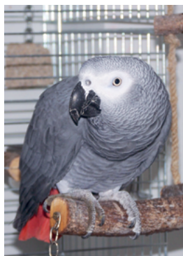
PAPOUŠEK ŠEDÝ: Žak, který bude vystavován jako ochočený a mluvící pták.

Chovatelé pořádající organizace, která vznikla v roce 1927 a je jednou z nestarších organizací zabývajících se chovem ptáků v České republice, se těší na bohatou účast návštěvníků a zároveň zvou mezi sebe i nové členy.