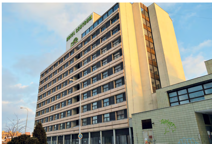
HOTEL CENTRUM: Statutární město Frýdek-Místek se konečně stalo majitelem se vším všudy.