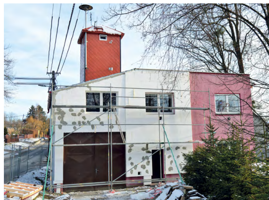
SKALICE: Nástavba má vyřešit zatékání.

podporovat složky, které se na zajištění bezpečnosti podílejí,“ ubezpečil náměstek Hořínek. (pp)