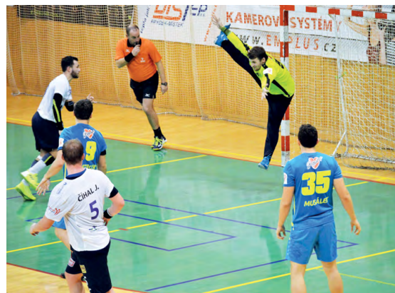
EXTRALIGA V PŮLI: SKP chce zapracovat na součinnosti obrany s brankáři.