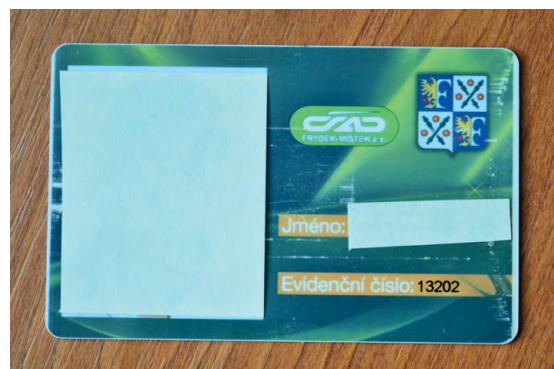
ZELENÁ KARTA: Tato karta na MHD zdarma pozbude platnost 10. prosince tohoto roku.

- je nutné vyřídit si potvrzení o bezdlužnosti vůči městu