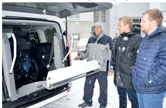
PŘEDVÁDĚNÍ HYDRAULICKÉ PLOŠINY: Město přispělo na dobrou věc.

„Plošina splňuje veškeré bezpečnostní normy, které jsou potřeba k přepravě vozíčkářů. Auto je přizpůsobené pro přepravu pěti lidí plus tři vozíčkářů. Máme speciální výtočnou sedačku, která je pro nemohoucí. Plošina uveze minimálně dvě stě kilo, protože elektrický vozík má v průměru okolo sta kilogramů,“ uvedl Petr Matýsek ze spolku Cesta bez barier. (pp)