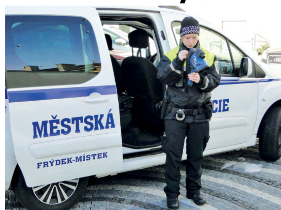
NOVÝ POMOCNÍK: Městská policie má k dispozici na neukázněné řidiče radar na měření rychlosti špičkových parametrů.

Zakupení radaru, bude-li používán preventivně a městská policie bude o místech jeho užití informovat, určitě přispěje ke zklidnění dopravy ve městě a zvýšení bezpečnosti všech účastníků provozu na komunikacích, včetně chodců a především dětí. Vzhledem k povaze otázek, které v této rubrice dostávám, odpovím dopředu univerzálně i na otázky, které očekávám do budoucna, jako např. zda-li vítám zakoupení nové multikáry pro svoz odpadu pro frýdeckou skládku nebo zda-li vítám zakoupení nové sekačky