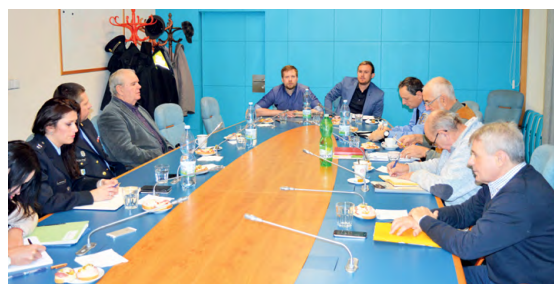
RADA SENIORŮ: Na setkání se probíralo, co radnice pro frýdecko-místecké důchodce chystá.

Zástupci republikové policie představili novou tiskovou mluvčí a potvrdili, že Frýdek-Místek je „hodně slušné město“, alespoň co se týče pohledu do policejních statistik. (pp)