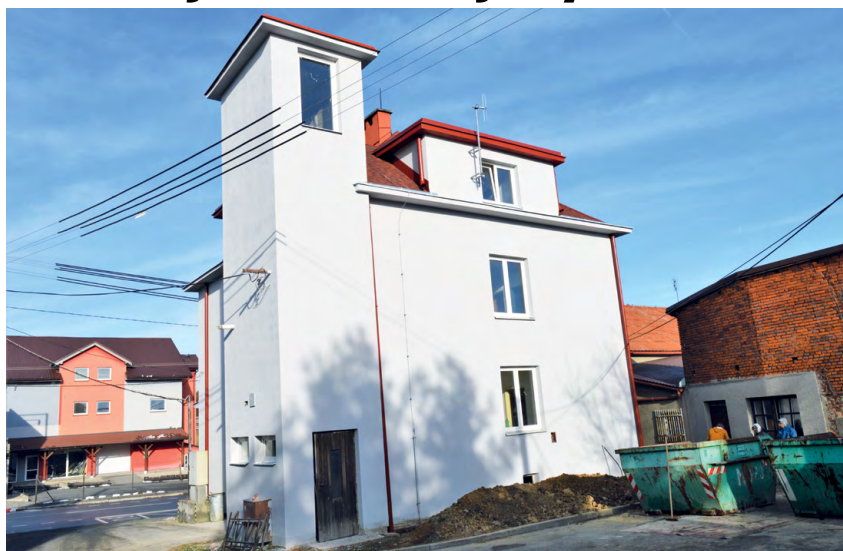
CHLEBOVICE: Zbrojnice si polepšila hlavně uvnitř budovy.

Požární zbrojnice v Chlebovicích loni získala novou elektroinstalaci i rozvody vody a odpadů, nové ústřední vytápění, nové sociální zázemí i opravené schodiště v garáži. Výměnou elektroinstalace prošla také zbrojnice v Liskovci. Hasičská zbrojnice v Zelinkovicích byla mimo jiné zbavena vlhkosti, získala novou střechu i novou podlahovou krytinu, opraveny byly vnitřní omítky a úpravou prošla i věž, která dostala nová okna a novou plošinu. Ke konci roku se začalo pracovat i na zbrojnici ve Skalici,