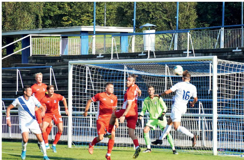
2. KOLO MOL CUPU: S druholigovým nováčkem z Blanska MFK Frýdek-Místek prohrál 1:2 gólem z penalty v závěru zápasu.

„Ve druhém poločase jsme byli určitě hodně vyrovnaným soupeřem, ba co víc, v některých pasážích i lepší. Byli jsme rychlí a přímočaří. Chybělo ale to fotbalové štěstíčko, abychom se více gólově prosadili. Pak jsme dostali v samém závěru hodně nešťastný gól. Ano, byl to faul, to nepopírám, ale určitě to nebylo ještě ve vřepně. Pískala se penalta, co můžeme proti tomu dělat. I po tom gólu na 1:2, jsme se neustále snažili o vyrovnání. Lítal to tam po bran-