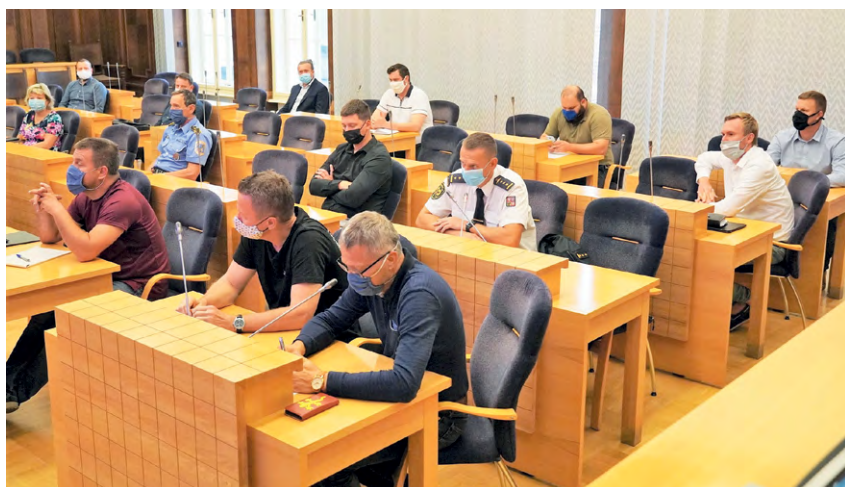
BEZPEČNOSTNÍ RADA MĚSTA: Všichni jsou připraveni.

„Největším úskalím je lidský faktor, někteří čle-