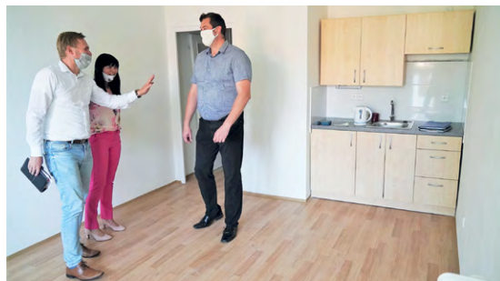
KONTROLA REKONSTRUKCE: Byt je připraven.

Není to tolik vidět jako jiné investiční akce, ale město neustále pracuje na odstraňování zane-