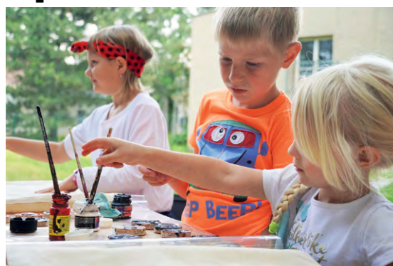
PESTRÉ PRAZDNINY: Děti se na akcích naučí i le-dacos vyrobit.