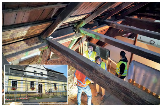
STŘECHA FOJTSTVÍ: Krytina domu včelařů výměnu potřebuje.

„Objekt je zapsán v Ústředním seznamu kulturních památek, je střediskem kulturního a společenského života v Chlebovicích, a proto je žádoucí, aby měl kvalitní střechu. Ta současná z eternitu už je za svou životností, propadá se a postupně přibývaly obtížné odstranitelné závady. Do nezařezaného podkroví při deštích zatékalo a hrozilo další poškození jak stropních konstrukcí, tak zde umístěných exponátů,“ vysvětlil primátor Michal