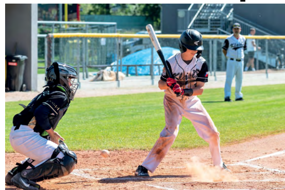
MLADÍ BASEBALLISTÉ: Z letošního zápasu U18 mezi Klasikem a Draky Brno.

I v této skupině čekaly na Frýdek-Místek pouze zápasy s extraligovými celky. Jenže mladí hráči Klasiku ukázali, že se neza- leknou ani proti favoritům a oba zbylé zápasy proti Kotlářce Praha a Arrows Ostrava vyhráli vysoko 9:0, resp. 11:1. Díky tomu si zajistili v silné konkurenci skvělé 5. místo, když za se- bou nechali hned tři zá- stupce z nejvyšší soutěže.