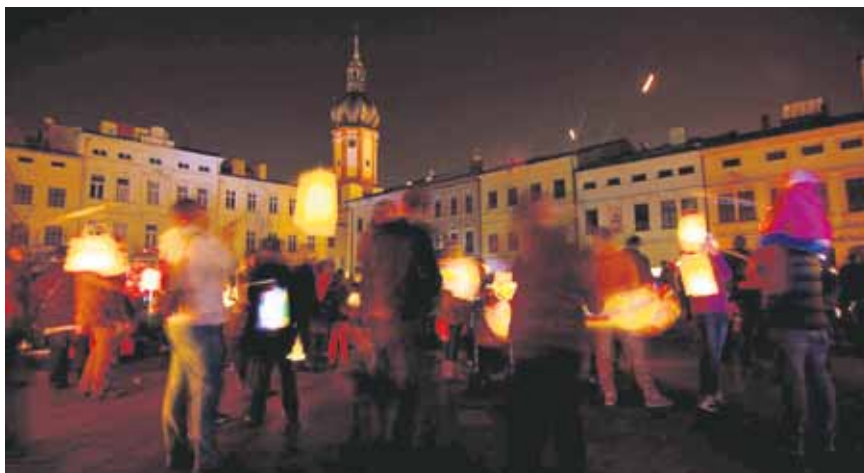
ÚČASTNÍCI LAMPIONOVÉHO PRŮVODU ROZZÁŘÍ NÁMĚSTÍ SVOBODY.

Na náměstí před příchodem průvodu zhasnou světla. Po trase budou zajišťovat bezpečný přechod silnic strážníci. (rs)