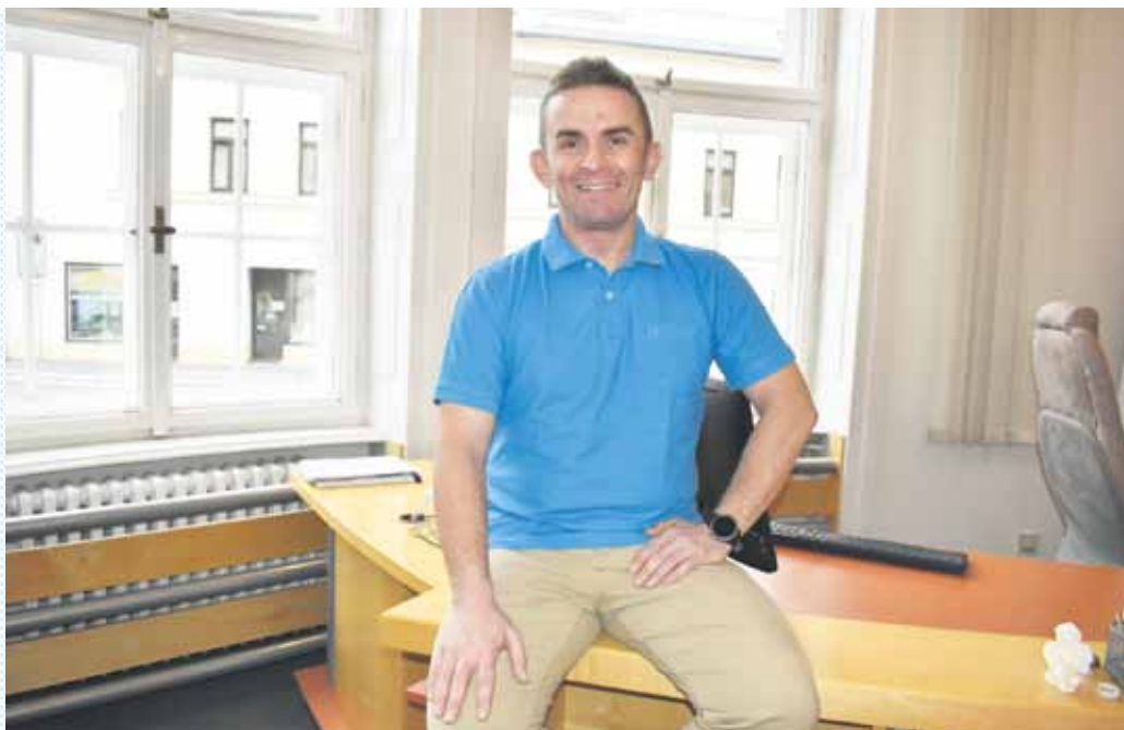
NÁMĚSTEK PRIMÁTORA IGOR JURÍČEK (PIRÁTI). FOTO: RENÉ STEJSKAL

Náměstek primátora Igor Juriček (Piráti) má ve své gesci sociální služby, zdravotnictví, informační technologie, participaci, digitalizaci a protidrogovou prevenci.