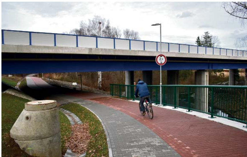
CYKLOSTEZKA V KVAPILOVÉ ULICI VZNIKLA ZA POMOCI DOTACE.

„Dotace pokryly náklady nejvíce ve výši 88 procent, u cyklostezky Kvapilova dotace pokryla 79,5 procenta nákladů a u domova pro seniory ve Školské ulici činila 63 procenta nákladů. U nového sídla městské policie se jedná o dotaci ve výši 50 procent a zde jsme navíc získali bezúročný úvěr 15,5 milionu korun,“ uvedl náměstek primátora Jakub Miček (ANO 2011). (rs)