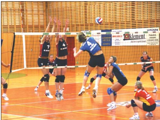
SOKOL - OLOMOUC: V posledním zápase doma mohl Frýdek-Místek jedině ztratit. Ztratil set.