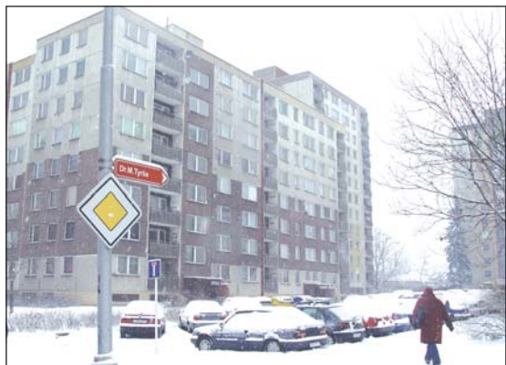
ULICE DR. M. TYRŠE: Sokolovna odsud není daleko.