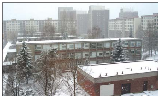
ULICE J. ČAPKA: Škola uprostřed sídliště Slezská.