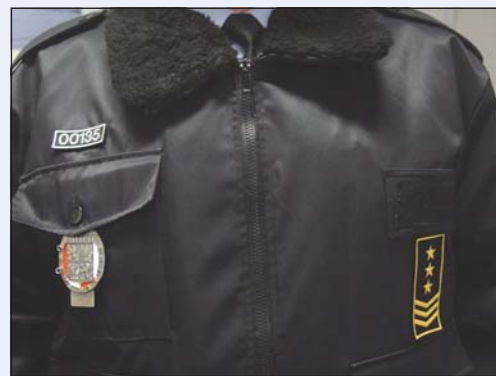
STRÁŽNÍCI V NOVÉM: Rok 2005 začali městští policisté v nových uniformách.

Zákonem dochází od 1. ledna ke změně poplatku školného v mateřských školách, ve školních klubech a školních družinách. Dosud se příslušnou vyhláškou zabývalo zastupitelstvo města. Nyní se školné