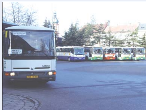
AUTOBUSOVÉ STANOVÍŠTĚ: Počátkem roku 2005 se veřejně začalo diskutovat o možnostech přemístění k vlakovému nádraží.

stává věcí řešenou pouze ředitelem školy. 2. ledna započala tradiční Tříkrálová sbírka. Během deseti dní kolektori vybrali ve Frýdku-Místku a v jeho okrajových částech téměř 376 000 Kč. Česká vláda vyhlásila na 5. ledna státní smutek. Vlajky byly spuštěny na půl žerdi. Ve 12 hodin se po dobu tří minut rozezněly sirény a zvony na uctění památky obětí katastrofy v jihovýchodní Asii. 8. ledna byl zahájen v Národním domě v 18 hodin XXXVIII. absolventský ples. 10. ledna ožily prostory Vyšší odborné školy Goodwill obrazy malířky Aleny Podzemné z Valašského Meziříčí. Kromě pastelů výstava uvedla její práce vytvořené pomocí gotických šablon. 11. ledna těžká technika provedla demolici kdysi chlouby, nyní zbytku suterénu pozdně barokních kupeckých domků na Hluboké ulici. 13. ledna byla v Brně zahájena výstava cestovního ruchu REGIONTOUR 2005, kde se představil Moravskoslezský kraj pod názvem Kraj kontrastů