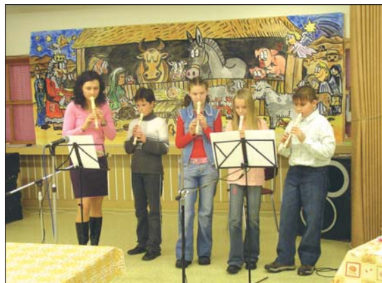
Malým zpěvákům i obecenstvu zahrál vánoční písničky dětský flétnový sbor z „Jedenáctky“ pod vedením Tány Janoškové.

Veselé notování, výstava Betlému a stánky plné vánočních výrobků, to vše čekalo ve čtvrtek 15. prosince na návštěvníky již tradičního vánočního jarmarku na základní škole Jiřího z Poděbrad.