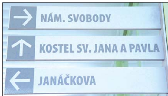
INFORMAČNÍ SYSTÉM: Nikdo by neměl zabloudit.

vnější strany kvůli provozu na komunikaci, bylo nutno provést místní zásahy proti zatékání. Speciálními tmely byly utěsněny dilatační spáry, ve vytípaných místech s průsakem vody byly instalovány sběrné panely s odvodem vody do kanalizace,“ osvětlil místostarosta Miroslav Dokoupil. (pp)