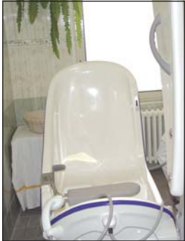
NEJVĚTŠÍ INVESTICE: Speciální pohovací vana vylepší komfort při hygieně.

Město investovalo dalších zhruba tři čtvrtě milionu korun do vylepšení standardu domova důchodců na Školské ulici. Toto zařízení se postupně vymaňuje z nevalné pověsti, kterou získalo tím, že