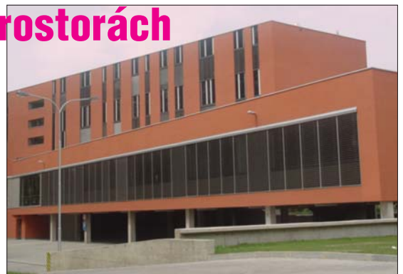
NOVÁ BUDOVA: Úřad práce v důstojnějších prostorech.

Stěhování Úřadu práce ve Frýdku-Místku nebude spojeno s přerušením jeho provozu, ale jen s částečným omezením. Uskuteční se ve dnech 15.-20. června. V tyto dny v úředních hodinách (pondělí 8-17, úterý 8-13, středa 8-17, čtvrtek 8-13, pátek 8-13) budou pouze přijímány žádosti o zprostředkování práce, resp. finanční příspěvky z prostředků aktivní politiky zaměstnanosti (tyto kromě pátku), a to ještě na stávajícím pracovišti na ulici Nádražní