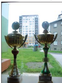
TROFEJE: Plně školní vitríny jsou motivací pro další žáky.

Ve středu 1. září 2004 usedlo do frýdecko-místeckých školních škamien 6285 žáků. To potvrdilo klesající trend, který k zrušení školy vedl. „Pokud srovnáme počty žáků, kteří do základních škol nastoupili letos a vloni, oproti loňsku ubylo 361 žáků,“ konstatovala tenkrát Ilona Nowaková, vedoucí odboru školství, mládeže a tělovýchovy.