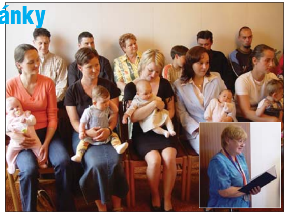
VÍTÁNÍ OBČÁNKŮ: Nejmladší z Lískovce přivítala primátorka Eva Richtrová.

Vaše láska, starostlivost a péče o zdraví vašeho dítěte, o jeho dobrou pohodu, rodinná atmosféra naplněná vzájemným porozuměním, laskavým vztahem