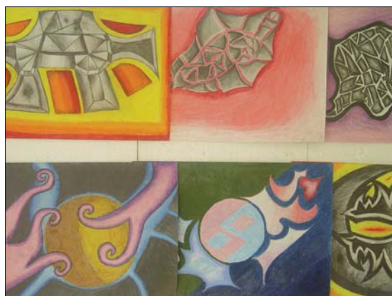
VÝTVARNÁ VÝCHOVA: Obrázky i velkoformátové obrazy zpřeměňují školní interiér.