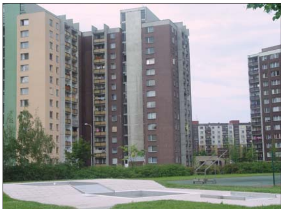
VODNÍ RADOVÁNKY: Kromě vnitřního bazénu škola dává prostor i maminkám s menšími dětmi.