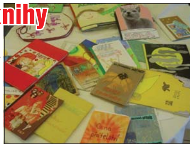
VLASTNÍ KNIHA: Vše originály.

„Kromě předání věcných cen čekalo na všechny přítomné obcerstvení a také doprovodný program. O zábavu se postaraly například taneční soubor Malá