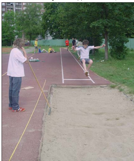
KVALITNÍ SPORTOVIŠTĚ: 11. ZŠ a sport jedno jest.