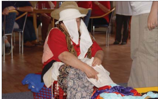
OBLÉKÁNÍ S HUMOREM: Senioři vědí, co je kořením života.

Vítězem se nakonec stalo družstvo z Penzionu pro seniory. Vůbec nejdůležitější ovšem bylo, že se všichni dobře bavili. (pp)