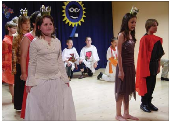
DĚTSKÉ DIVADLO: Na 9. ZŠ otevřeli speciální učebnu.