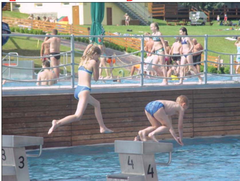
AQUAPARK OLEŠNÁ: První víkend po otevření využilo možnosti zchladit se v horkých dnech okolo 2500 lidí.