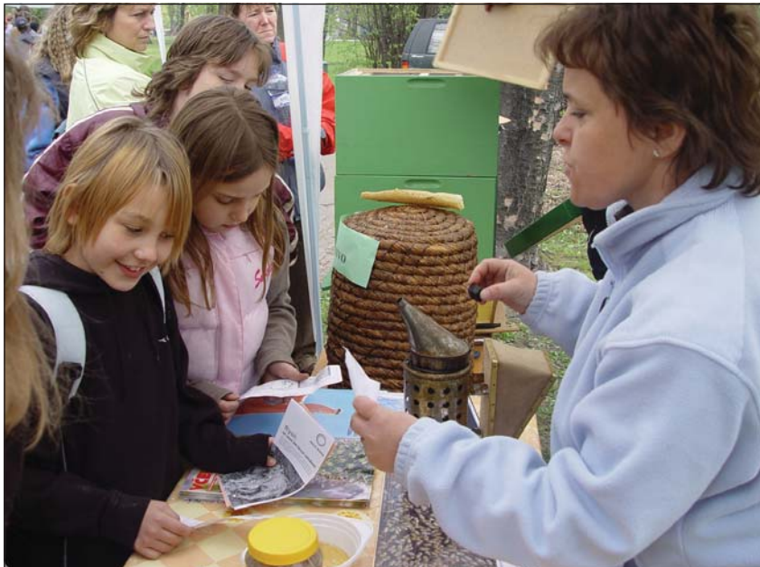
NA DNI ZEMĚ: Včelaři učí děti mít vztah k přírodě.