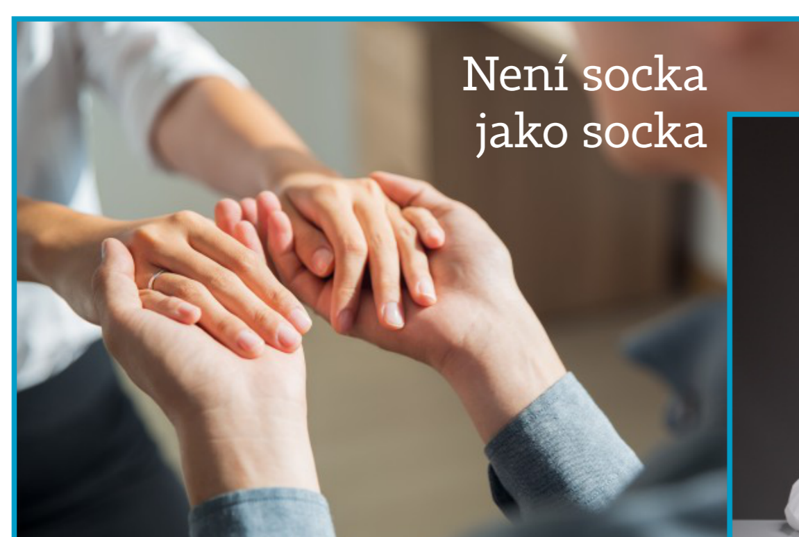
Není socka jako socka