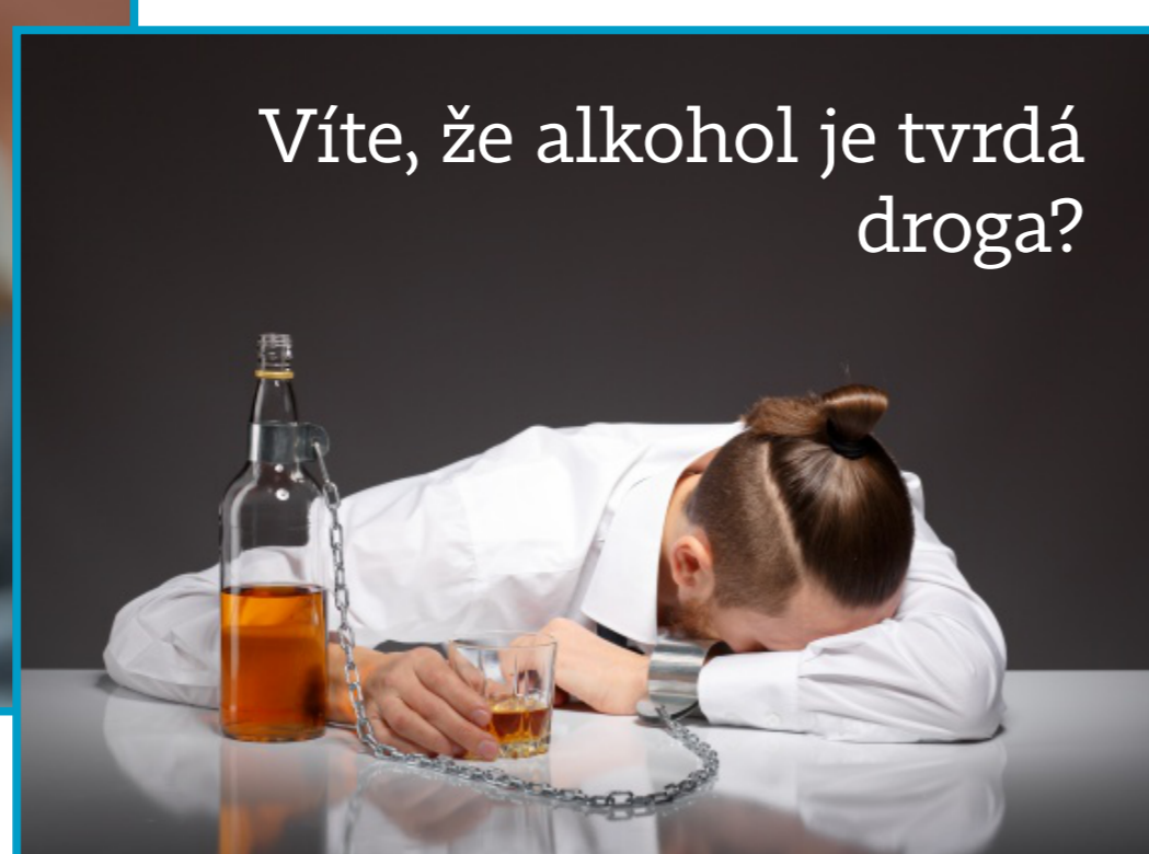
Víte, že alkohol je tvrdá droga?