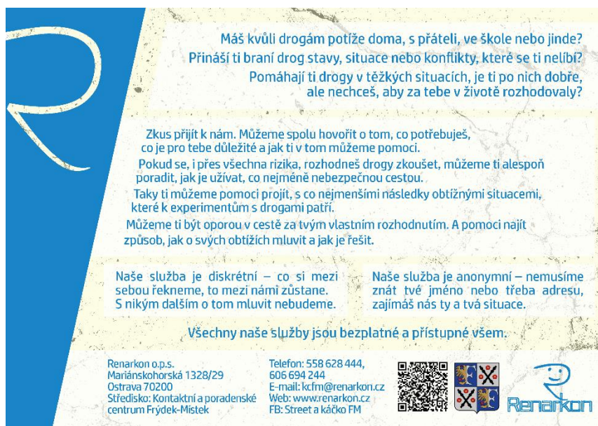
Obrázek 2: Informační leták pro děti a mladistvé - Renarkon, o. p. s. - Kontaktní a poradenské centrum Frýdek-Místek